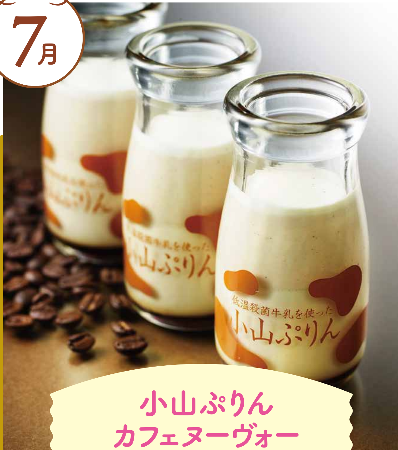
小山ぶりん カフェヌーヴォー