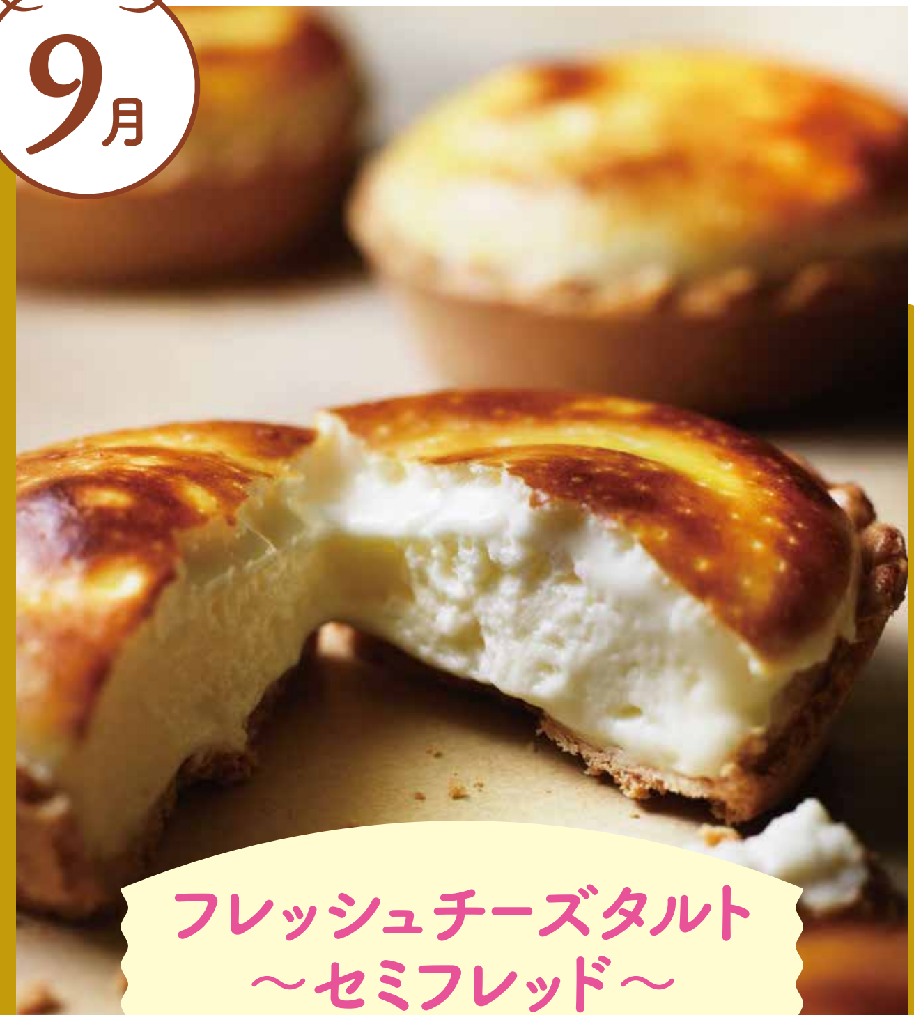
フレッシュチーズタルト ～セミフレッド～