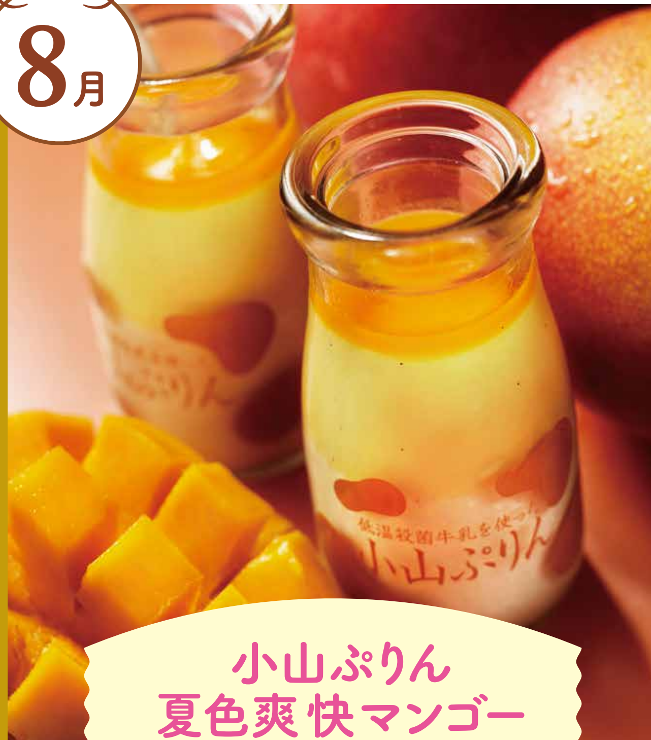
小山ぶりん 夏色爽快マンゴー